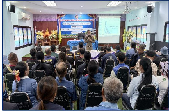
ให้ความรู้ ประชาสัมพันธ์ แก่ตัวแทน หัวหน้าชุมชน