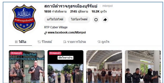
Toktok : สภ.เมืองบุรีรัมย์