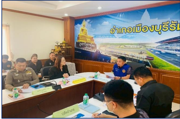
ร่วมประชุม นำเสนอข้อมูลกับหน่วยงานราชการที่