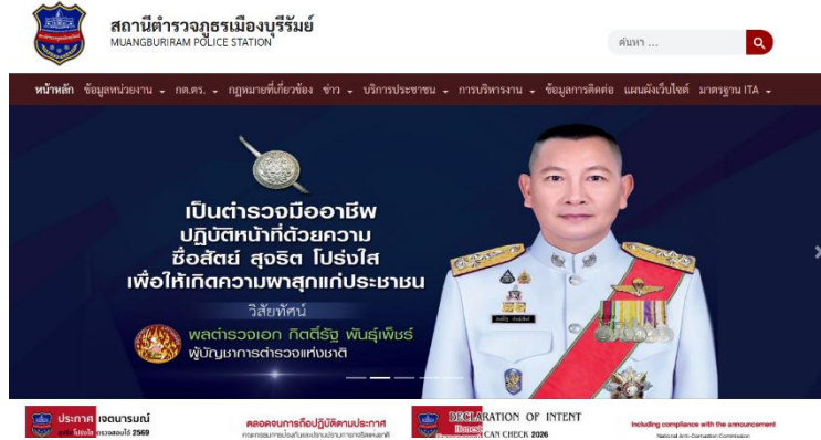
Website: สถานีตำรวจภูธรเมืองบุรีรัมย์