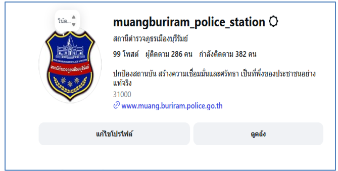
Instagram สภ.เมืองบุรีรัมย์