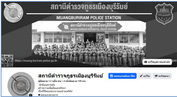
Facebook สภ.เมืองบุรีรัมย์